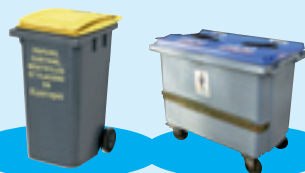
Bac à couvercle jaune