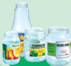
Les bocaux de conserve