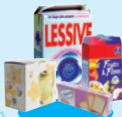
Les boîtes et emballages en carton