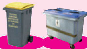
Bac à couvercle jaune