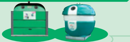
Conteneurs à verre