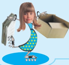
Le papier carton