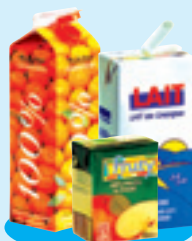
Les briques alimentaires