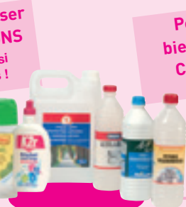
Les produits divers