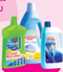
Les produits d'entretien