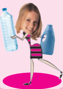
Bouteilles et flaconnages en plastique