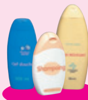
Les produits d'hygiène