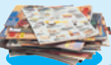
Les prospectus et les magazines