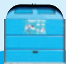
Conteneur à papier carton