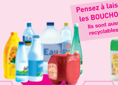
Les produits alimentaires (y compris, les bouteilles d'huile)