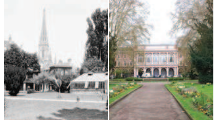
Square Steinbach avant 1910