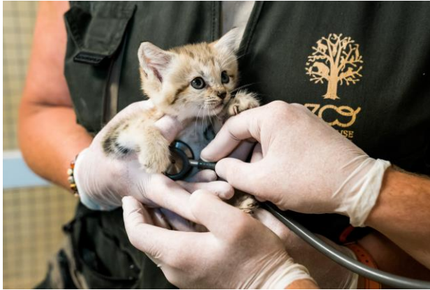
Chat des sables, né au Parc en juin 2022

Elle publie en moyenne 3 articles scientifiques par an et intervient dans de nombreux colloques ou conférences (environ 12 colloques ou conférences par an).