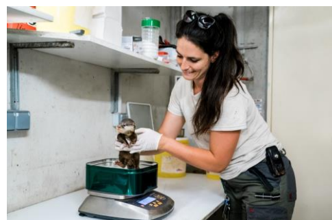
Pesée d'un loutron, né au Parc en mai 2022

En effet, le Parc accueille 1 200 animaux, issus de 170 espèces répertoriées, dont 85 font partie d'un EEP (EAZA Ex-situ Program) impliquant le respect de recommandations relatives aux conditions d'hébergement et de reproduction.